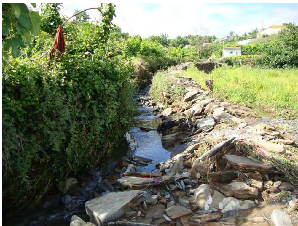
S. JOÃO DA PESQUEIRA – 30/05/2011