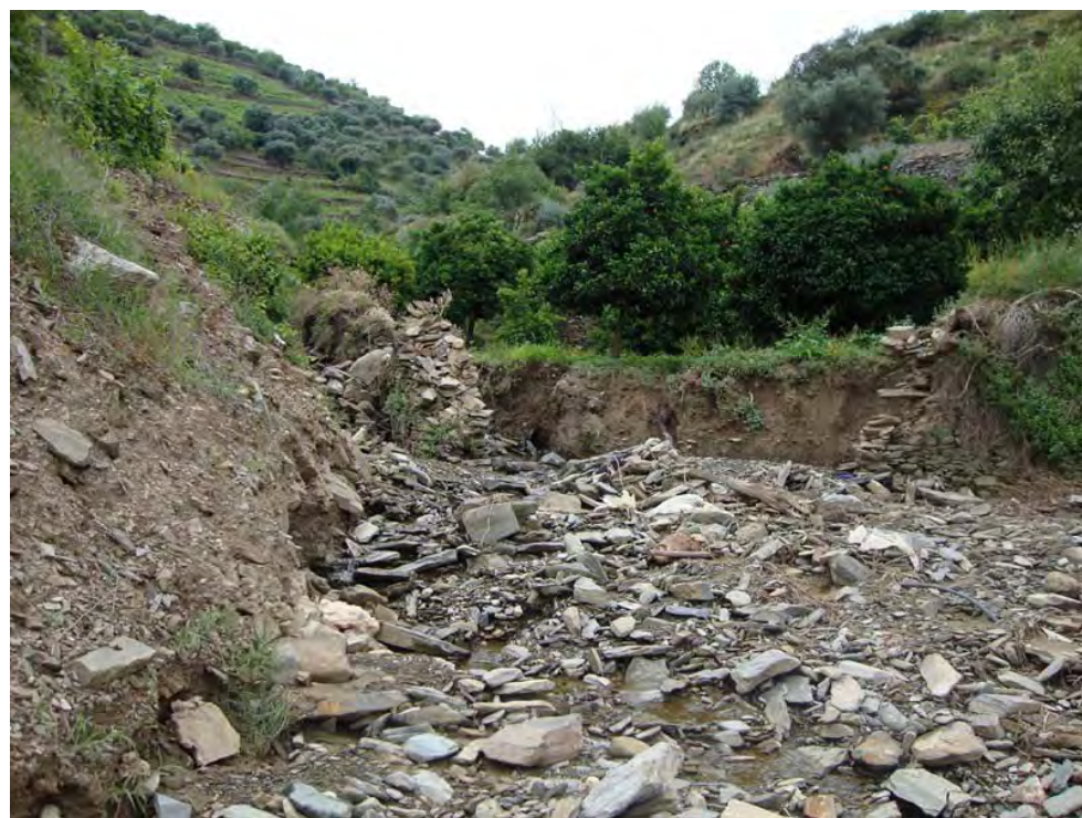
SOUTELO DO DOURO – 30/05/2011