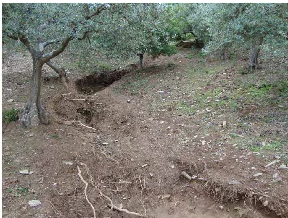
NAGOSELO DO DOURO – 26/05/2011