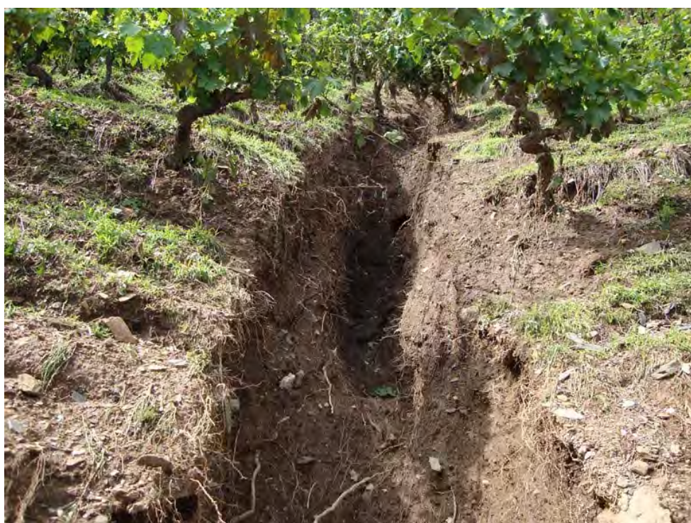
NAGOSELO DO DOURO – 26/05/2011