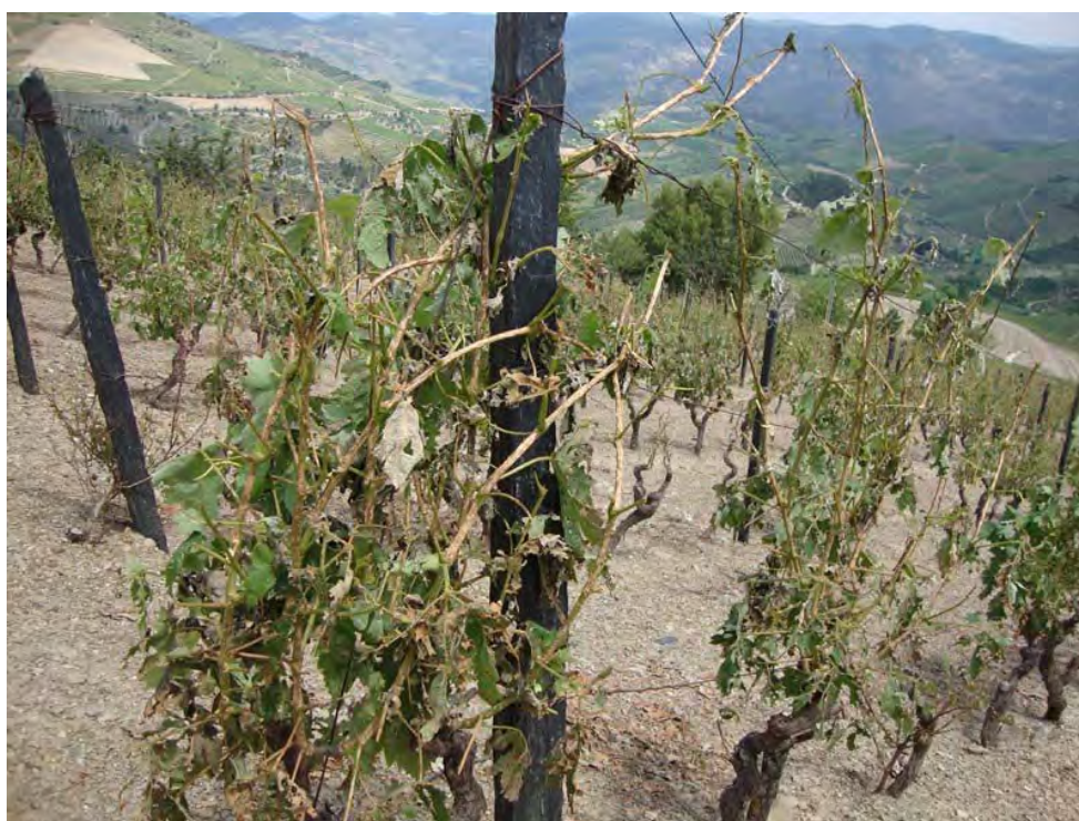
NAGOSELO DO DOURO – 26/05/2011