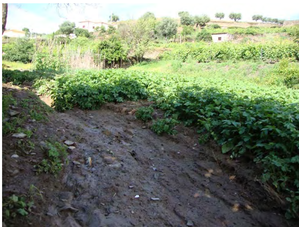
S. JOÃO DA PESQUEIRA – 30/05/2011