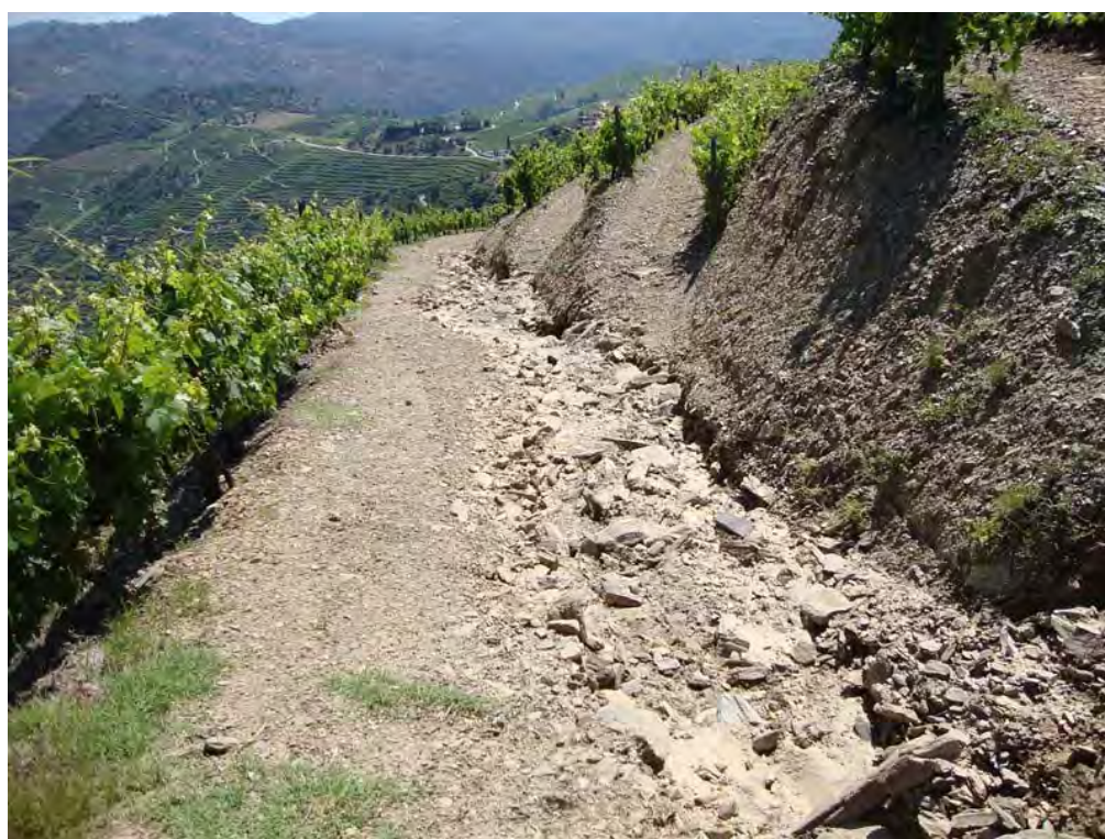
SOUTELO DO DOURO – 30/05/2011