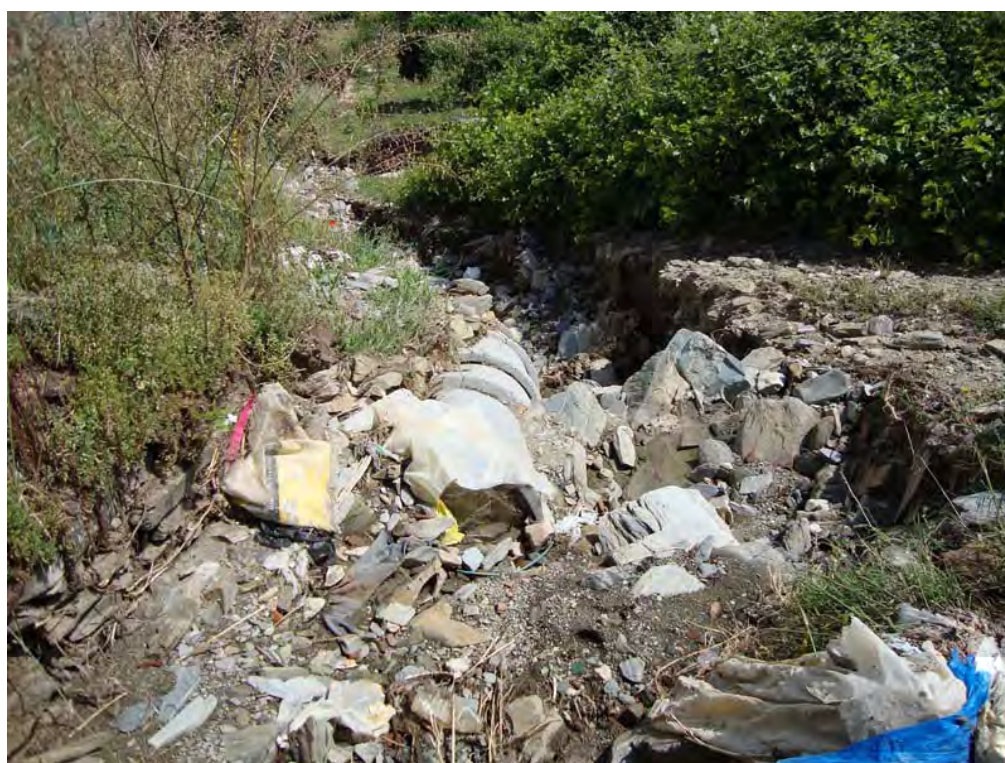
SOUTELO DO DOURO – 30/05/2011