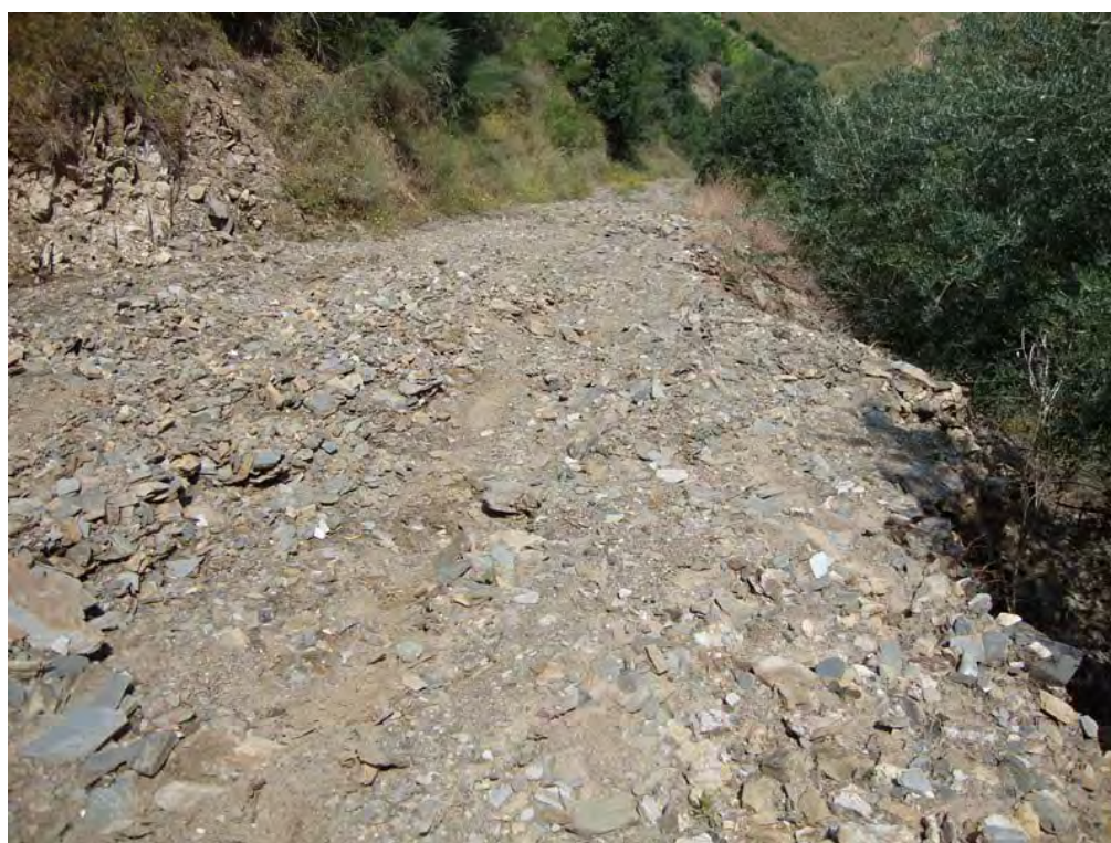
SOUTELO DO DOURO – 30/05/2011