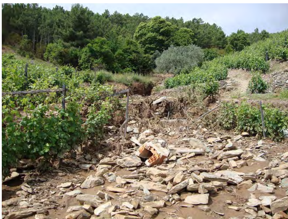
NAGOSELO DO DOURO – 26/05/2011