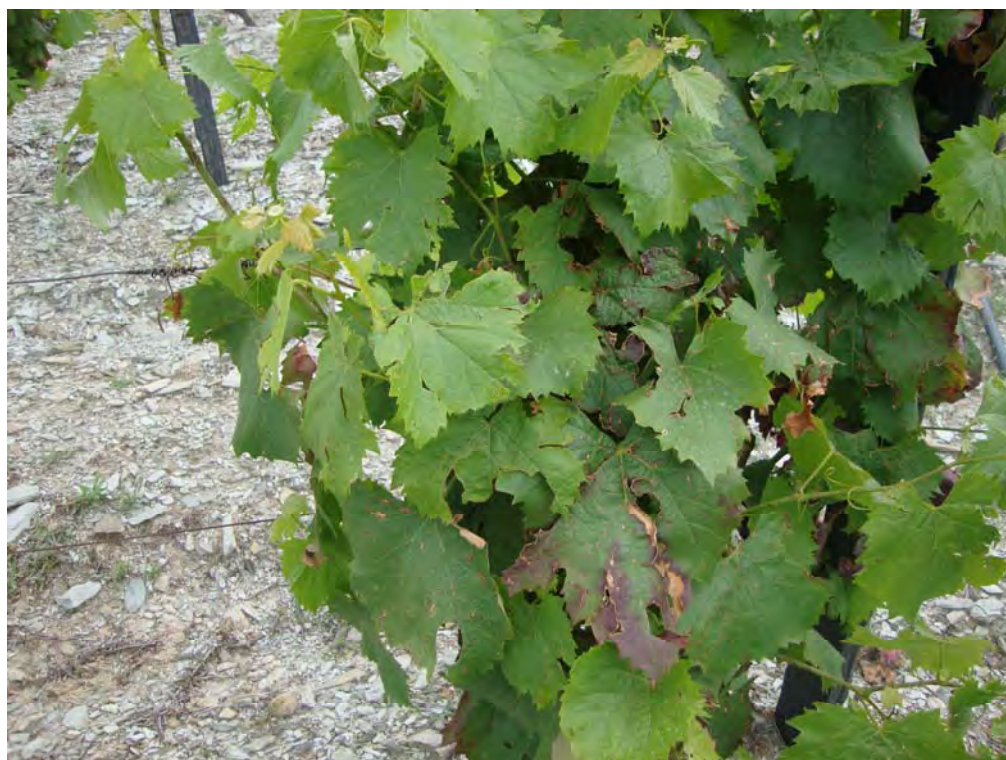
S. JOÃO DA PESQUEIRA – 30/05/2011