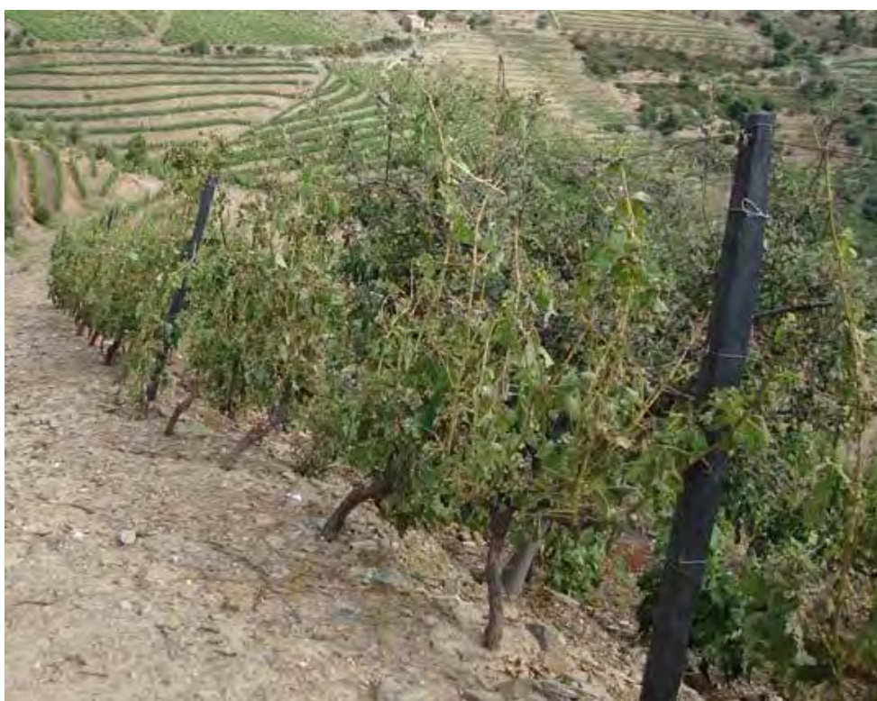
NAGOSELO DO DOURO – 26/05/2011