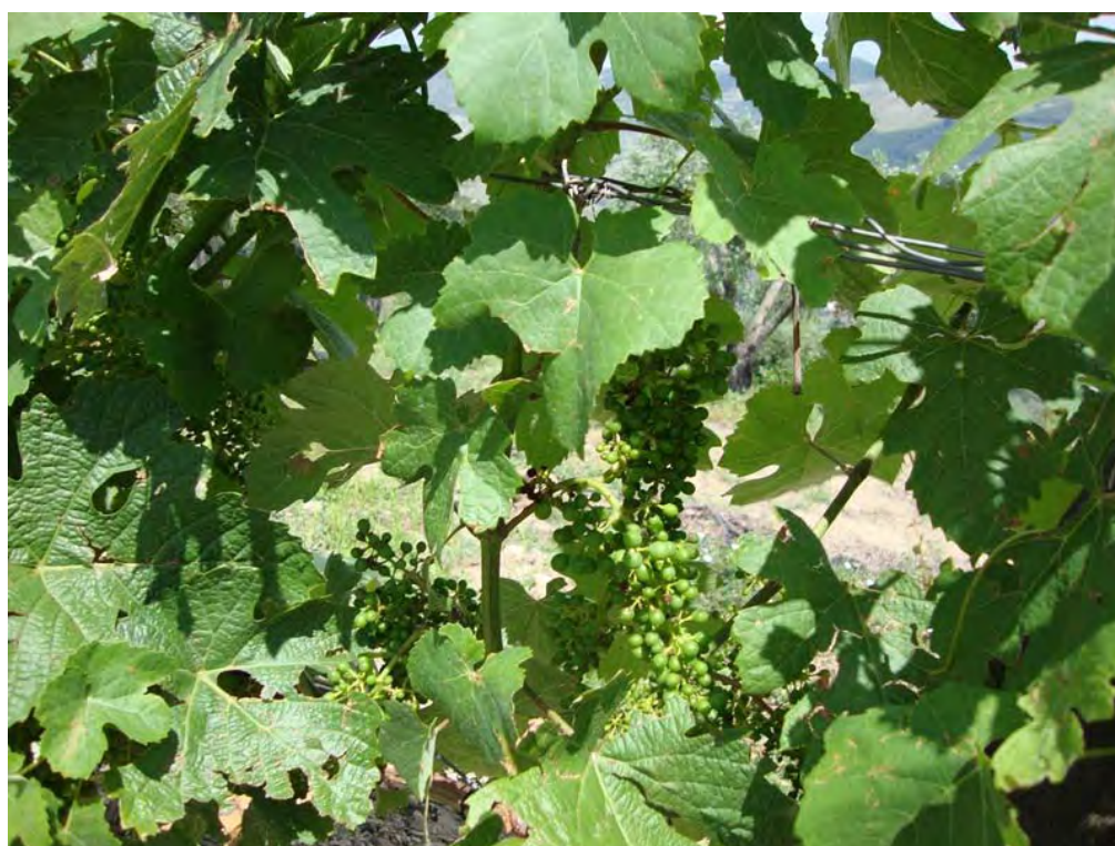
SOUTELO DO DOURO – 30/05/2011