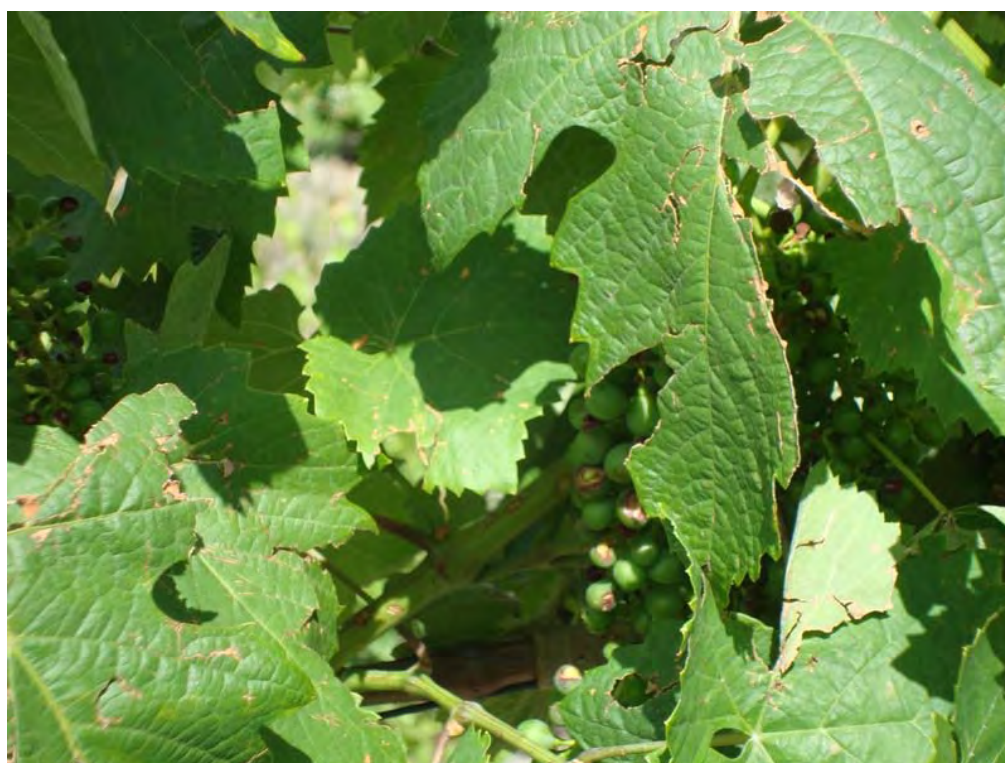
SOUTELO DO DOURO – 30/05/2011