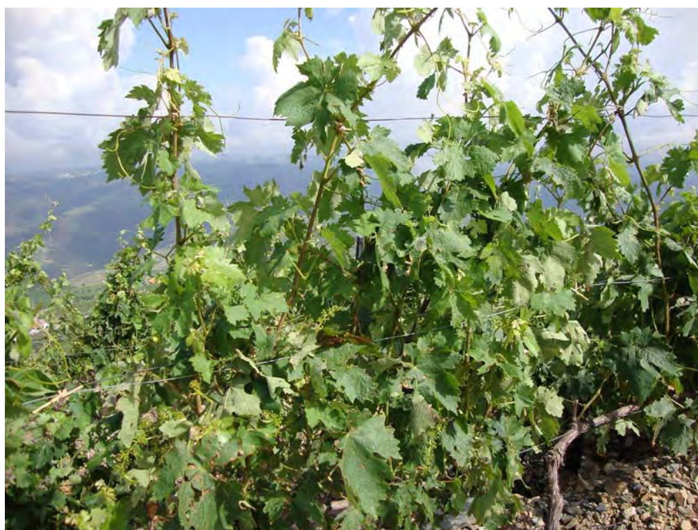
SOUTELO DO DOURO – 30/05/2011