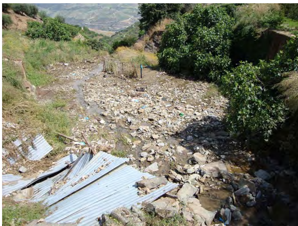
SOUTELO DO DOURO – 30/05/2011