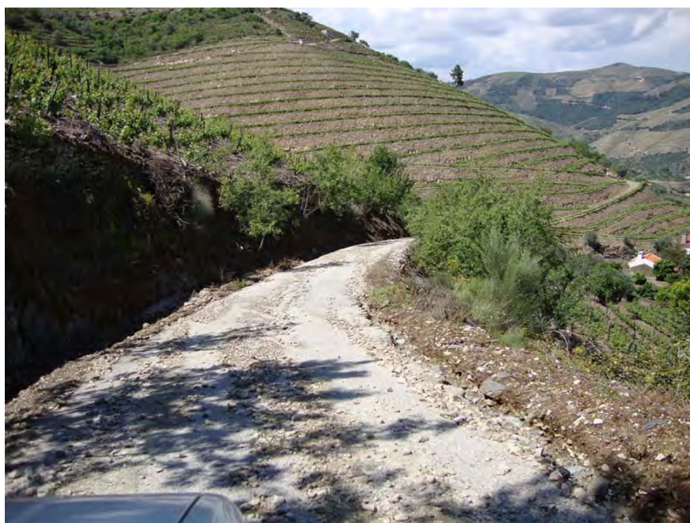
SOUTELO DO DOURO – 26/05/2011