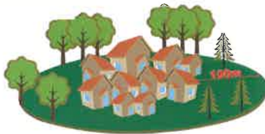
AGLOMERADOS POPULACIONAIS = FAIXA DE 100 METROS

O não cumprimento do disposto constitui contraordenação punível com coima de acordo com a legislação em vigor.