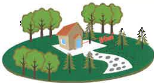
CASAS ISOLADAS = FAIXA DE 50 METROS